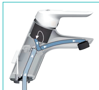
Idealpure® Schoon water en energie besparen