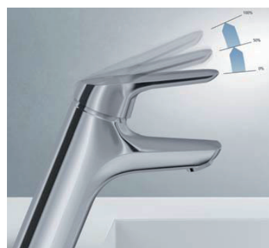
Click-technologie 50% waterbesparing